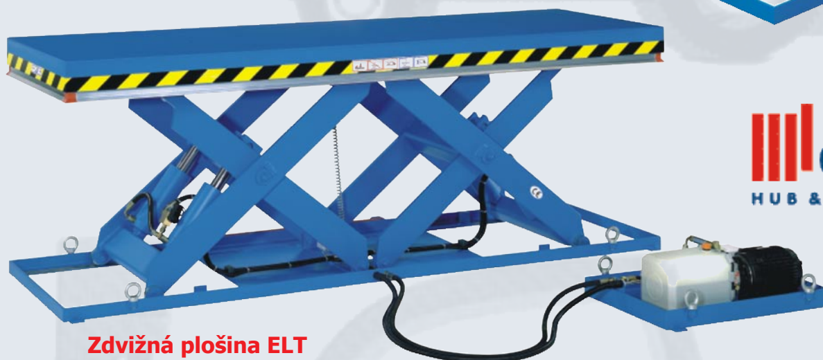
Zdvižná plošina ELT Nosnost 1 500 - 10 000 kg