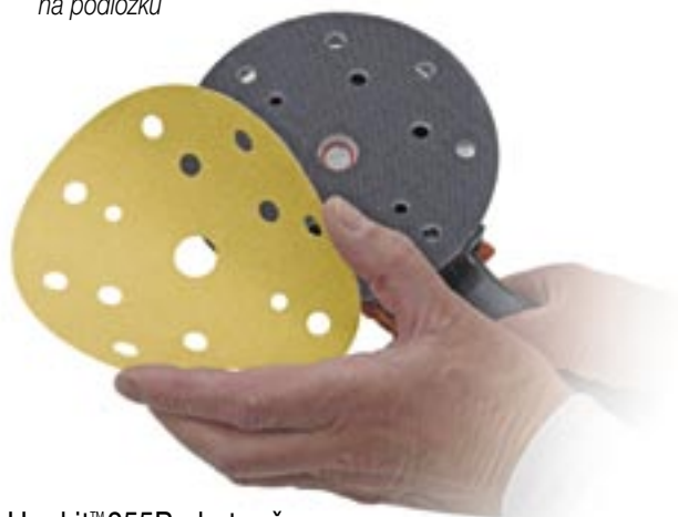
Hookit™ 255P+ kotouče patnáctiděrové LD861A 150mm průměr